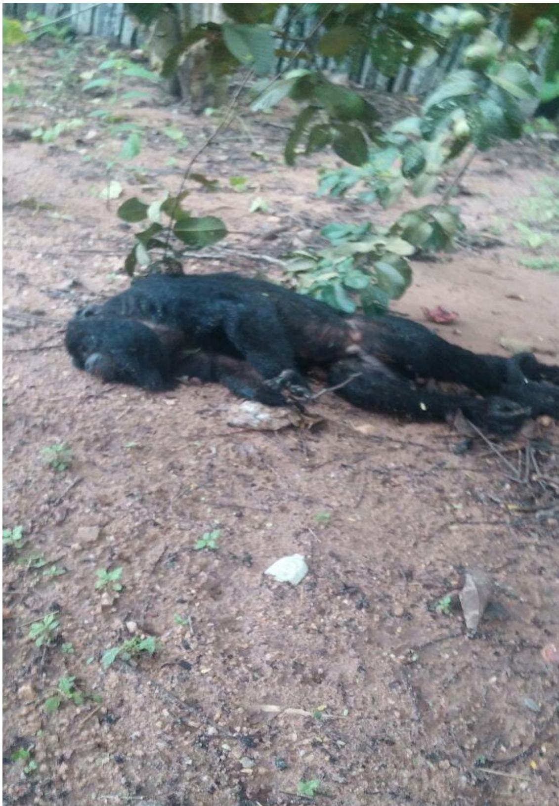
Foto 2. PNH encontrado