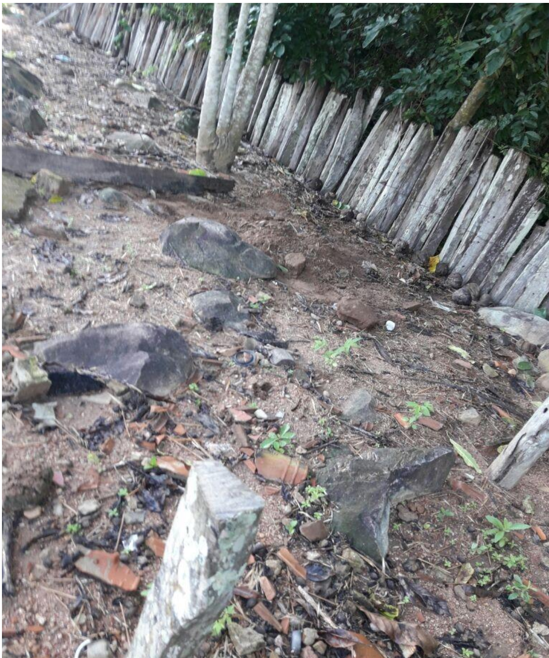
Foto 1. Local onde o PNH foi encontrado

Prefeitura Municipal de Araputanga Rua Antenor Mamedes, N° 911, Araputanga-MT Fone: (65) 3261-1100 – FAX: (65) 3261-1100 E-mail: prefeitura@araputanga.mt.gov.br