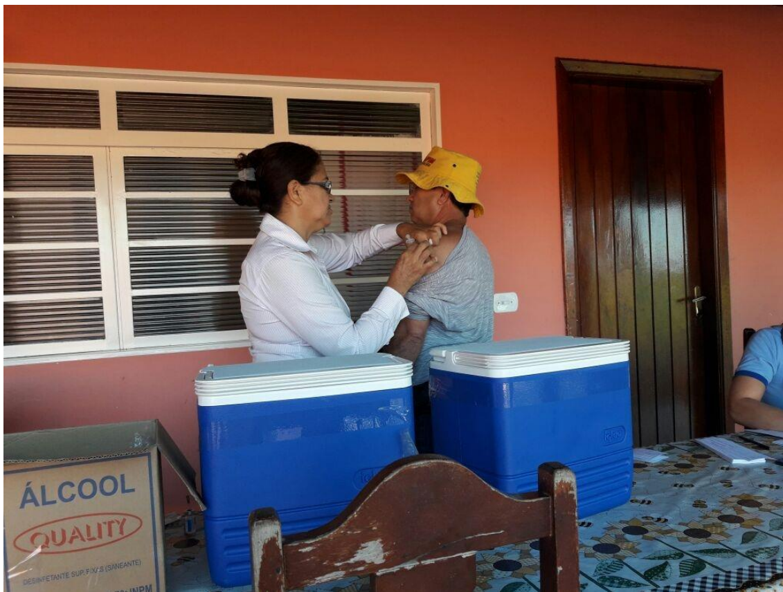
Foto 4. Ação de Imunização com vacina de Febre Amarela

Prefeitura Municipal de Araputanga Rua Antenor Mamedes, N° 911, Araputanga-MT Fone: (65) 3261-1100 – FAX: (65) 3261-1100 E-mail: prefeitura@araputanga.mt.gov.br