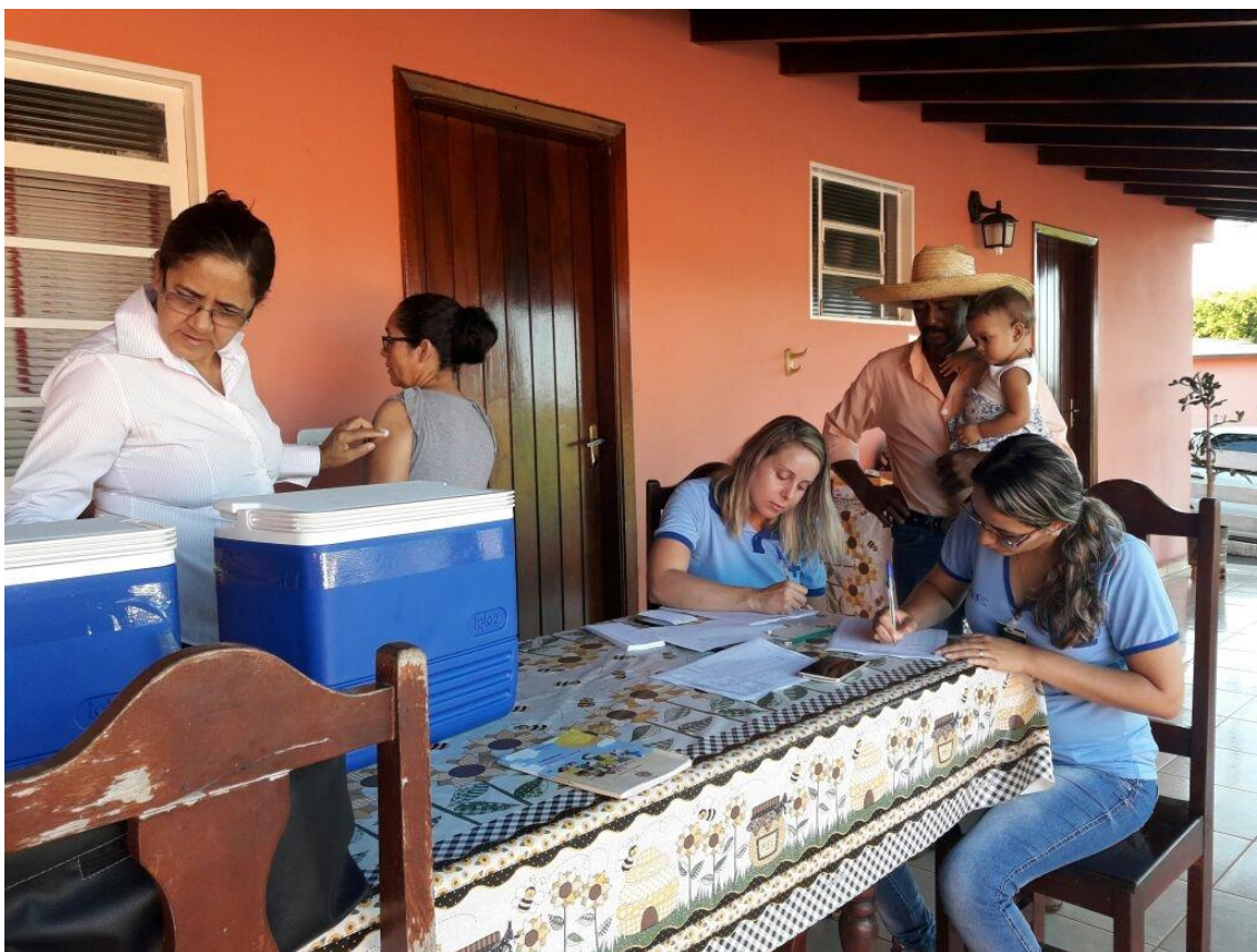
Foto 5. Ação de Imunização com vacina de Febre Amarela

Estado de Mato Grosso PREFEITURA MUNICIPAL DE ARAPUTANGA CNPJ 15.023.914/0001-45