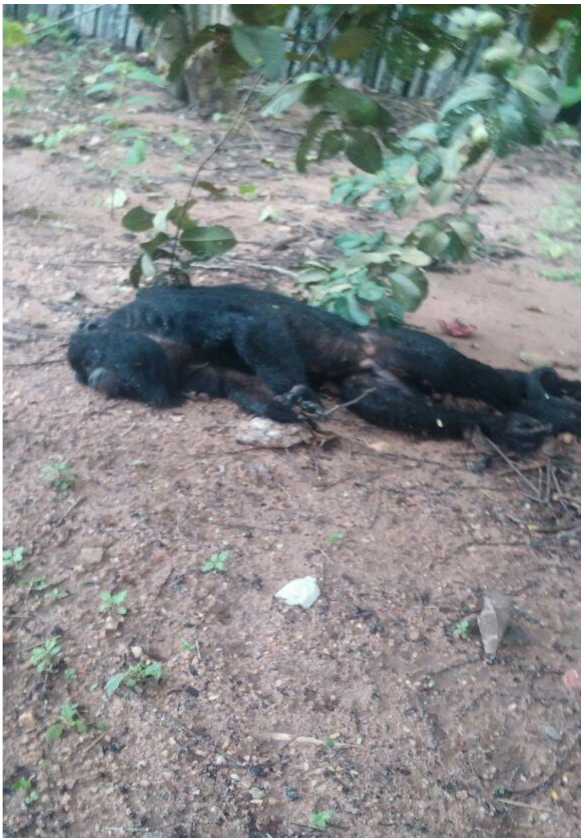
Foto 2. PNH encontrado

Estado de Mato Grosso PREFEITURA MUNICIPAL DE ARAPUTANGA CNPJ 15.023.914/0001-45